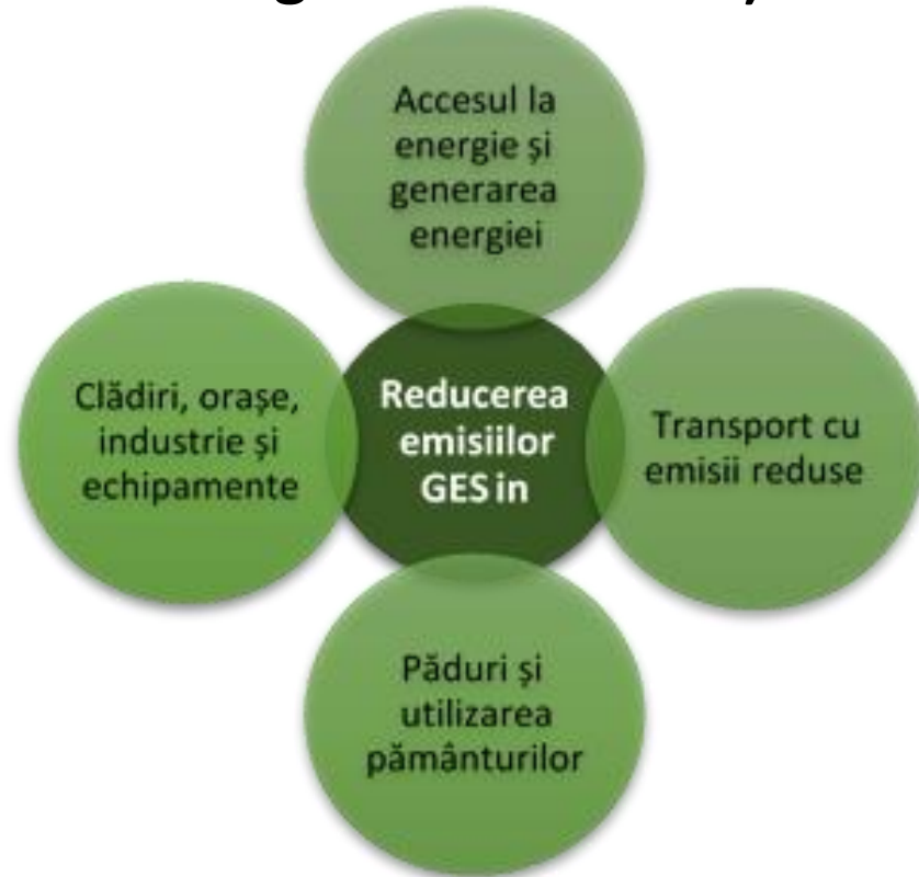
Direcțiile strategice de atenuare